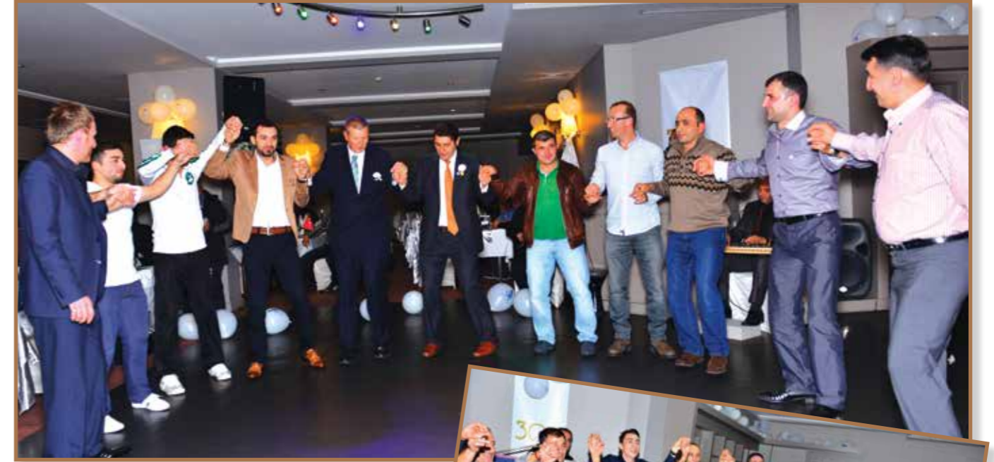
Çalışanlarımız 30. yılımızı horonla kutladı

Sonbahar Çayeli Bakır'ın kutlama aylarıydı. Hem 2012'deki başarılarımızı hem de 30. yılımızı partilerle kutladık. 20 Eylül, 21 Eylül, 23 Eylül ve 7 Ekim tarihlerinde organize ettiğimiz partilerde çalışanlarımız bir araya geldi. Tüm yılın stresinin atıldığı partiler sırasında eğlenceli zamanlar geçirdik. Yöresel müziklerle eğlenip horon eden çalışanlarımız, Çayeli Bakır'ın 30. yılı şerefine 30 dilek feneri uçurdu. Eğlencede çocuklar da unutulmadı. Partiler sırasında çocuklarımızın yaptığı birbirinden güzel resimler de sergilendi.