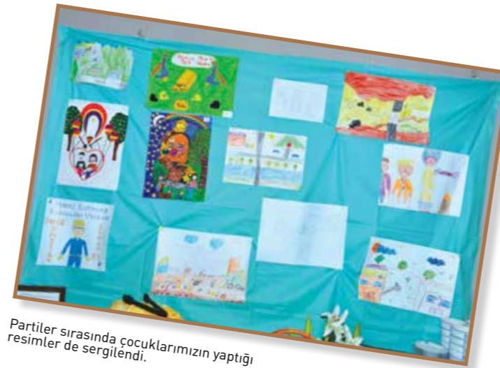
Partiler sırasında çocuklarımızın yaptığı resimler de sergilendi.