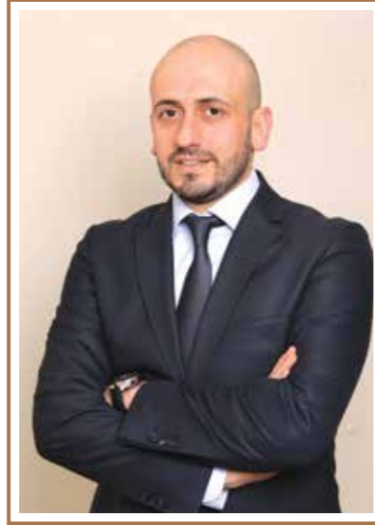
Ali Can Ticaret ve Finans Müdürü

ÇBİ’de 30 yıl...Dile kolay aslında. Türkiye’de madencilik sektörünün ‘lokomotifi’ olan ve kurulduğu günden bu yana çalışanlarının çabalarıyla ve artan azim ve kararlılıkla faaliyetlerini sürdüren bir işletmenin birer halkasıyız. Gözümüzün önünde büyüyen bu çınarın bir parçası olmanın haklı gururunu eminim benim gibi bu şirkette çalışan arkadaşlarım da yaşıyor ve bu dinamğin aynı şekilde sürdürülmesini arzuluyor. Temennimiz cevher rezervimize yenilerinin katılmasıyla daha uzun yıllar Çayeli Bakır’ın bu yöreye, bu ülkeye değer katmaya devam etmesi.